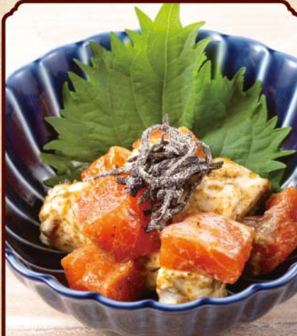
メイプルサーモンと クリームチーズの塩昆布マリネ 750(税込)

Maple salmon and cream cheese marinated with salted kelp