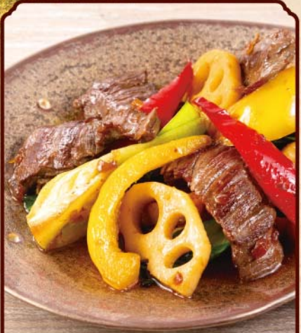
仔牛ハラミと加賀れんこんの オイスター炒め 990(税込)

Stir-fried veal skirt steak and kaga lotus root with oyster sauce