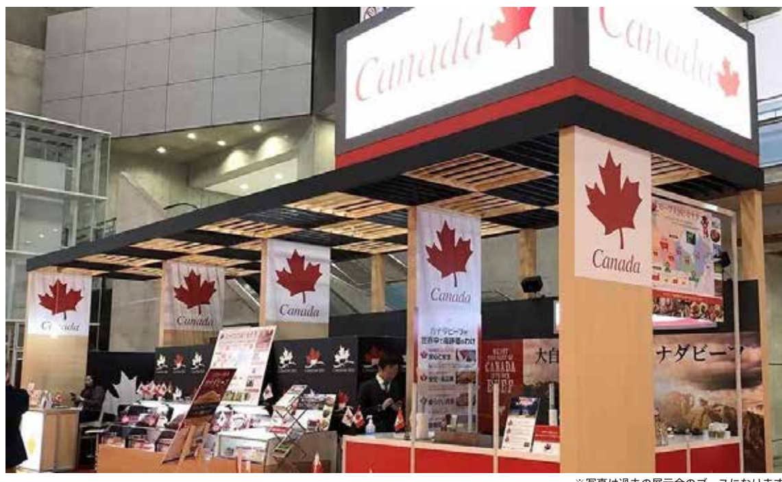
※写真は過去の展示会のブースになります。